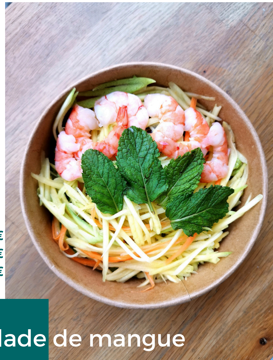
Salade de mangue

BROCHETTE POULET 1,30€ BRIOCHE AU PORC LAQUE 3,50€ ROULEAU DE PRINTEMPS 2,50€