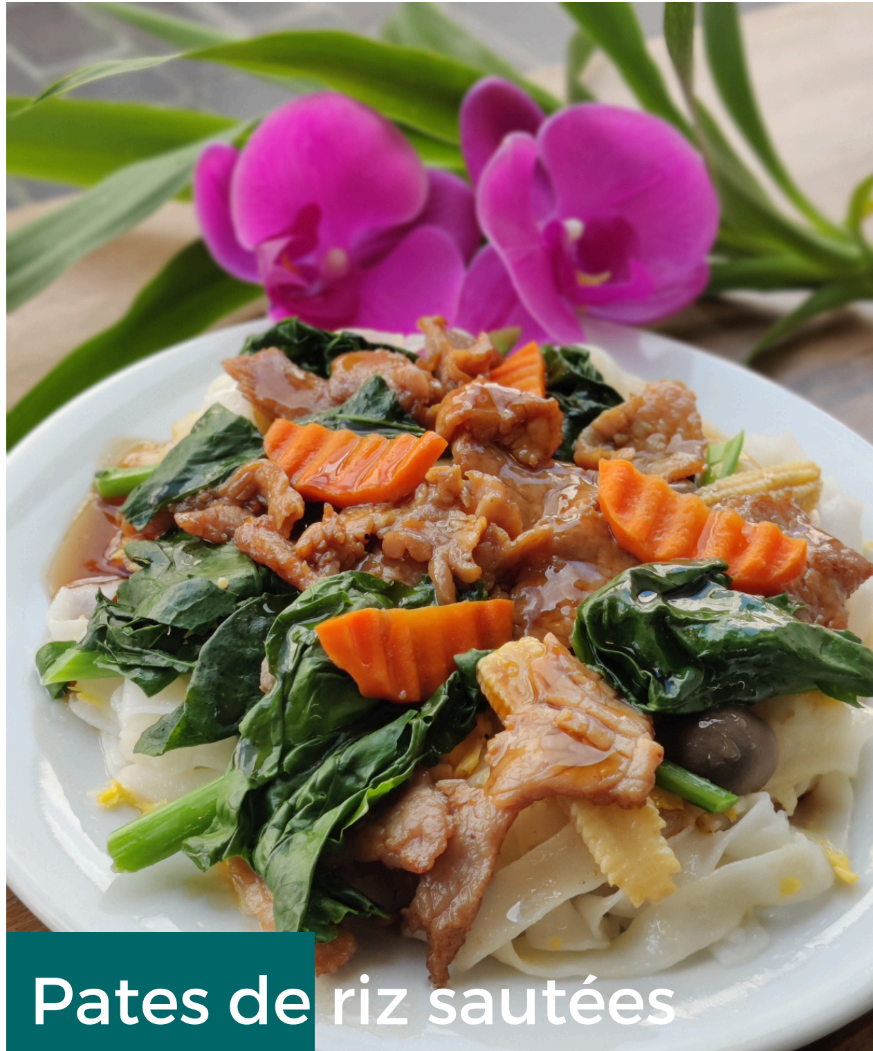
Pates de riz sautées